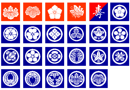
既製紋一覧 他別注紋も取り扱っております。