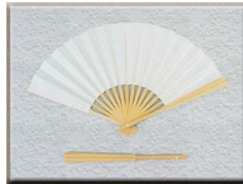
男性用 モーニング扇子

末広がりといわれ、おめでたい意味をもつ扇子は結納儀式や結婚式の時もそれぞれにふさわしい扇子を用意しましょう。