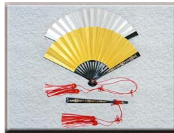
新婦用 金銀まき絵房付扇子

おめでたい日を飾るにふさわしい各種掛け軸を取り揃えております。結納日はもちろん、お祝いの度にご利用頂けます。