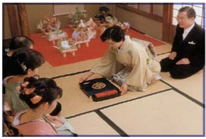
広蓋・掛ふくさ・風呂敷の3点セットです。目録、または結納品をお渡しする際、ご利用頂くとより丁寧な結納になります。