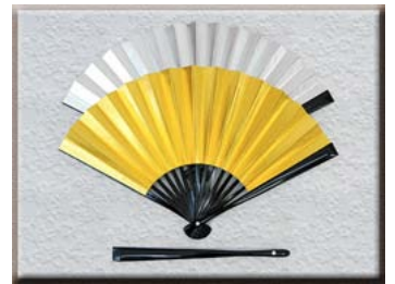
お母様用 金銀扇子