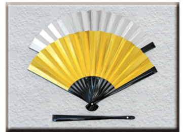
お母様用 金銀扇子