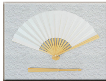
男性用 モーニング扇子

末広がりといわれ、おめでたい意味をもつ扇子は結納儀式や結婚式の時もそれぞれにふさわしい扇子を用意しましょう。