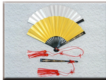
新婦用 金銀まき絵房付扇子

おめでたい日を飾るにふさわしい各種掛け軸を取り揃えております。結納日はもちろん、お祝いの度にご利用頂けます。