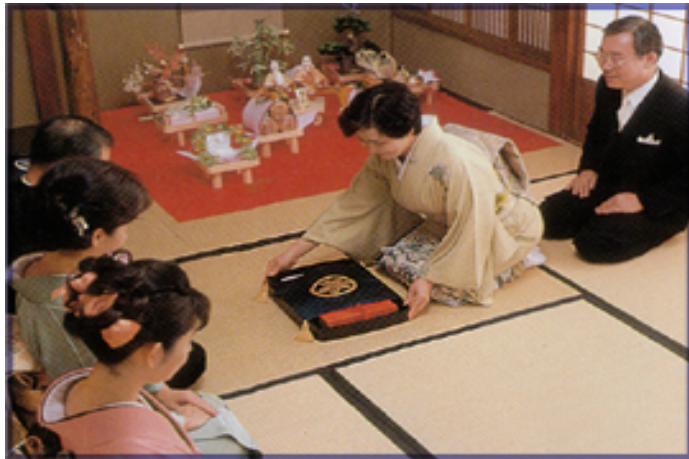
広蓋・掛ふくさ・風呂敷の3点セットです。目録、または結納品をお渡しする際、ご利用頂くとより丁寧な結納になります。